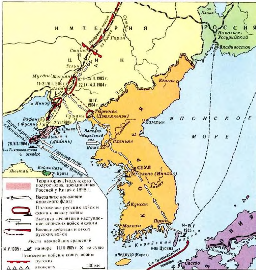
Русско-Японская война 1904-1905 гг.