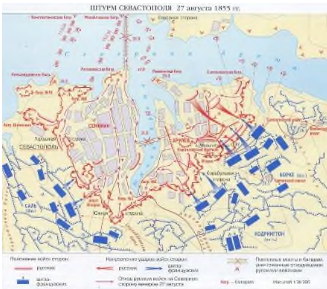
7. Крымская война. 1853-1856 гг.